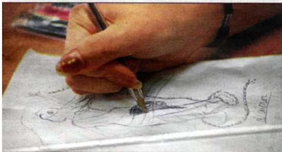
Un des dessins

Sérignan, la classe de troisième option « arts plastiques » du collège Marcel Pagnol participe au concours organisé par La Poste et le ministère de l'Éducation nationale afin de créer une série de 3 timbres.