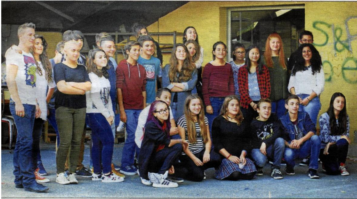
La classe d'arts plastiques